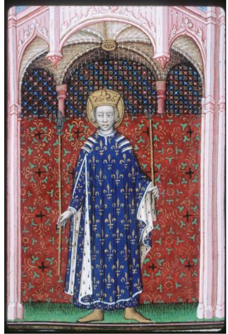
Bréviaire à l'usage de Paris - 1414